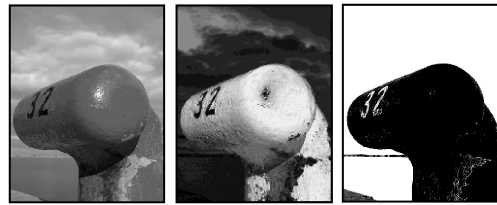
а) б) в) Рисунок 2 – Насиченість та колірний тон

значення для ахроматичних кольорів. Аналіз превалюючого внеску компонент RGB, у формування цифрового зображення на множині 100 тестових зображень показав, що у 73% зображень превалює компонента R ( C_1 = R ), компонента G ( C_1 = G ) – 22% зображень, компонента B ( C_1 = B ) – 5%.